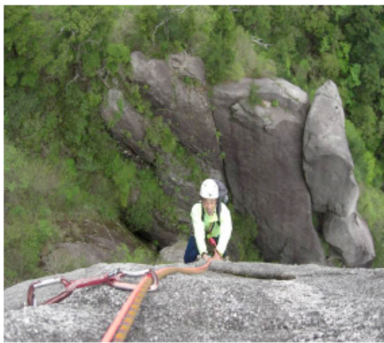
6~7ピッチ間の岩の隙間を抜ける「下の窓」